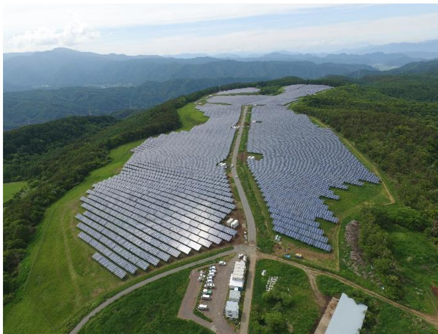
長門牧場メガソーラー発電所遠景