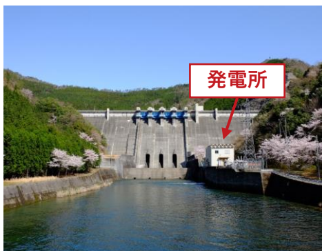
宮前(みやまえ)水力発電所