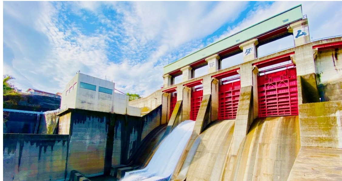
三瀬谷(みせだに)水力発電所