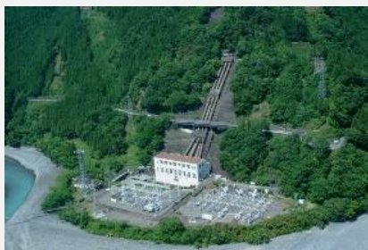
【大井川水力発電所】