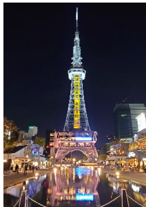
■ ライトダウンイベント カウントダウン時イメージ